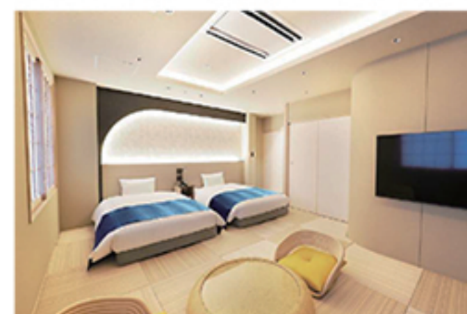
(株)アベストコーポレーション

当ホテルは、高槻市の「ホテル及び旅館の誘致等に関する条例」に基づき弊社が選定され、自治体との連携を通じて、地域ニーズに即したホテル開発を推進しています。客室以外に地域の方々から求められた宴会・会議のできるコンベンション施設を整備し、最上階には大浴場とジムを付帯致し、レストランでは高槻の野菜生産者の協力を得てヘルシーな朝食・ランチを提供しご宿泊のお客様や地域の皆様の健康の一助になればと考えています。また、旅行客や市民の皆様の回遊性のある活力ある街づくりの拠点となる施設として、全国で初めてホテル単独で経済産業省の「特定民間中心市街地経済活力向上事業計画」の認定を頂いています。