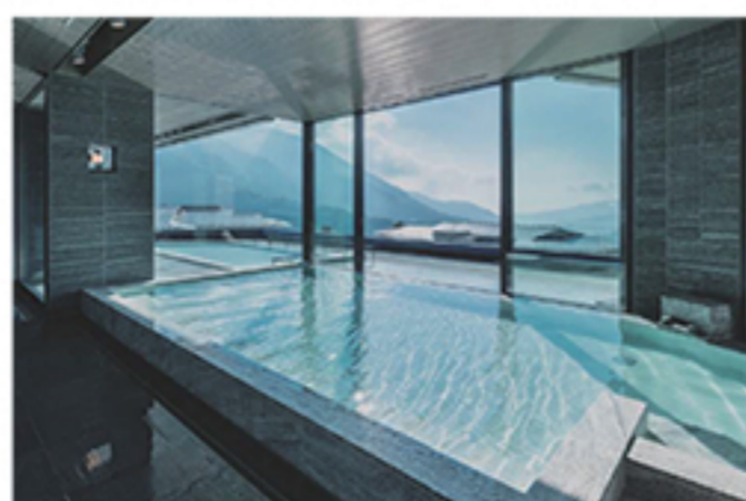
オリックス・ホテルマネジメント(株)

ORIX HOTELS & RESORTSのフラッグシップブランドとして誕生した「佳ら久」は、自分らしく思い思いの時をお過ごしかけるよう創り上げられたラグジュアリー旅館リゾートです。「麗らかな活力が生まれる場所。」をコンセプトに、慮りのおもてなしと、さまざまな「間(AWAI)」を大切に、人・地域・時をつなげ、本質を妥協なく突き詰めた最上級の体験を創り上げます。「箱根・強羅 佳ら久」では、豊かな自然と気品ある文化の流れが息づく箱根・強羅で、山海の絶景を望む露天風呂と多彩なお食事をお楽しみいただけます。